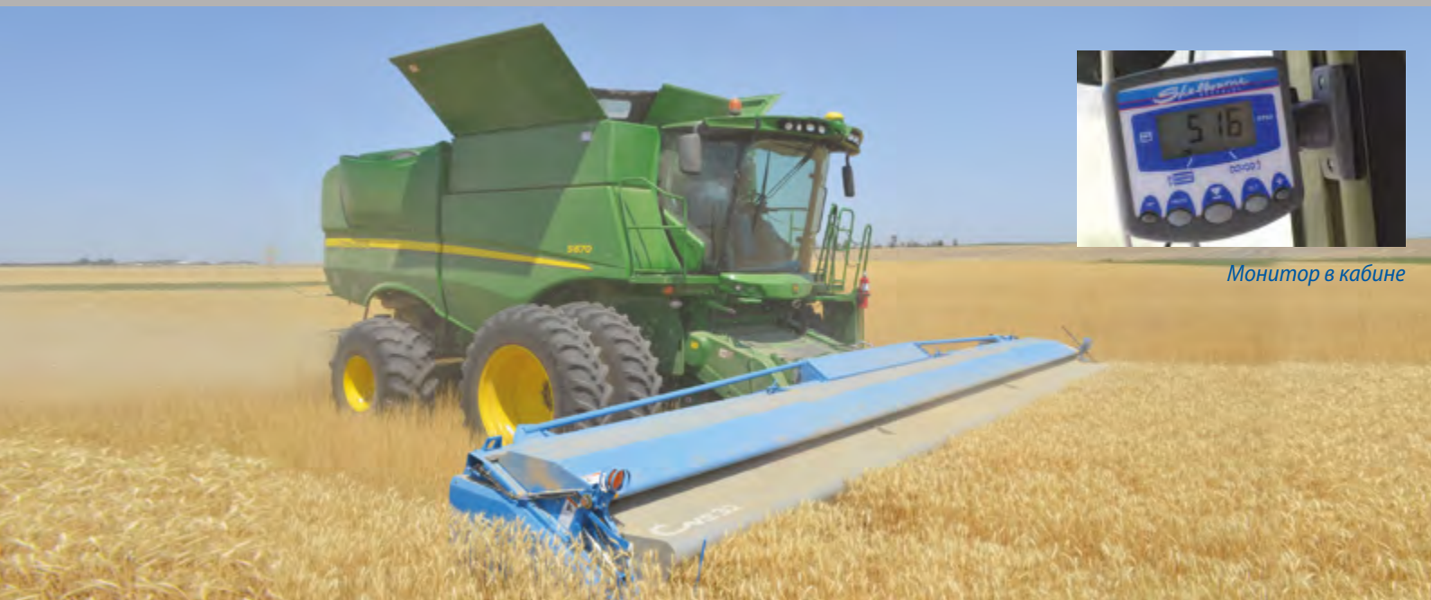
Монитор в кабине

Инженеры Shelbourne Reynolds обнаружили, что производительность комбайна ограничена способностью перерабатывать большое количество соломы и отделять от нее зерно.