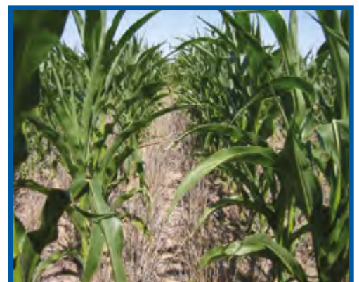
Кукуруза в стерне пшеницы (no-till)

ОСТАТКИ ПШЕНИЦЫ БЕЗ ОРОШЕНИЯ/УПРАВЛЕНИЕ ВЛАГОЙ: