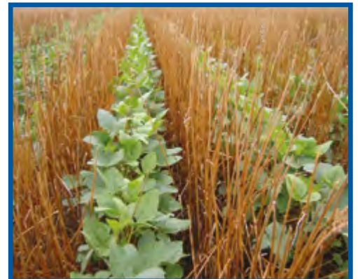
Бобы в пшенице (no-till)