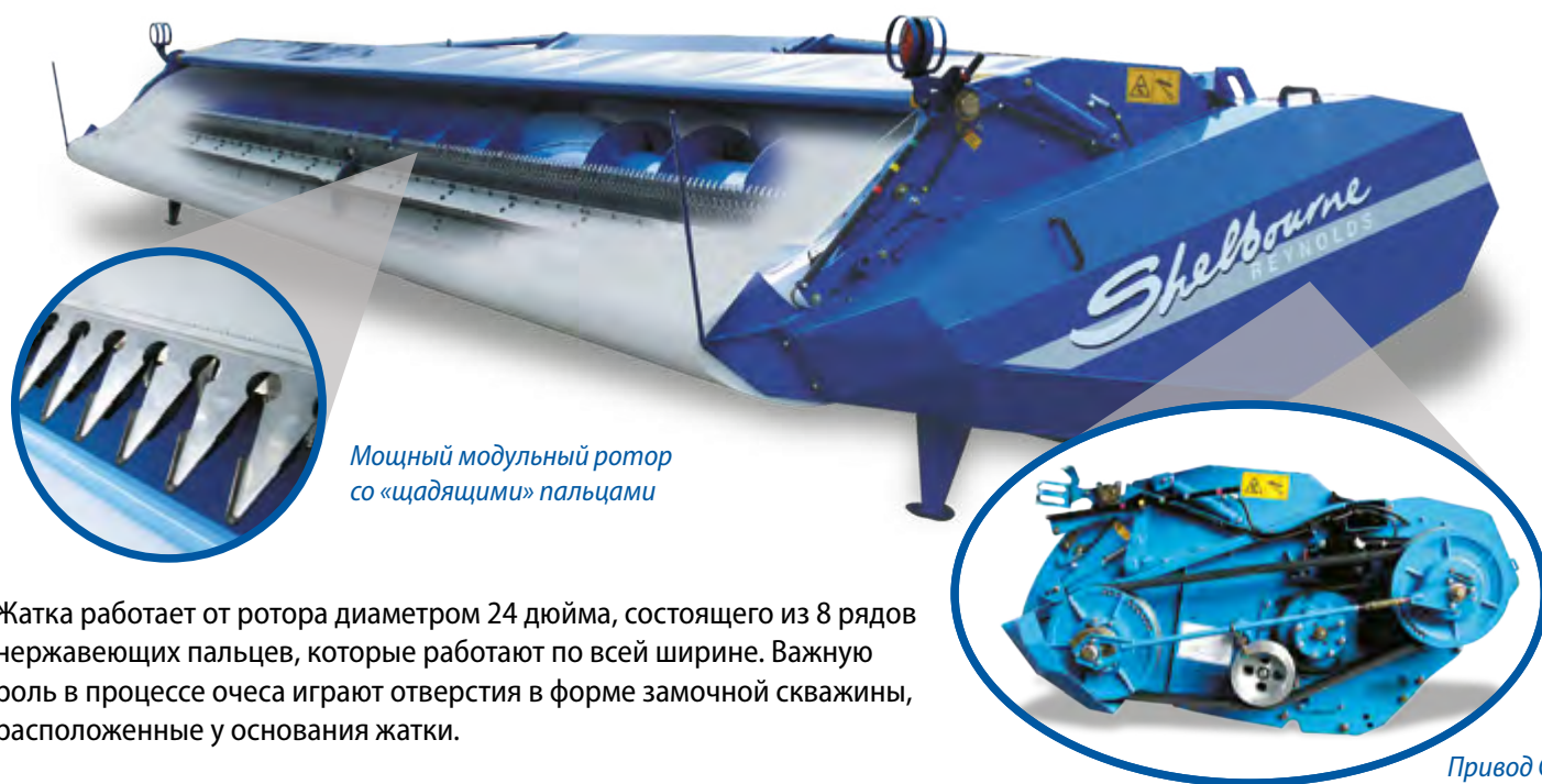
Мощный модульный ротор со «щадящими» пальцами

Благодаря жатке Shelbourne в комбайн поступает меньше соломы, и его производительность увеличивается.