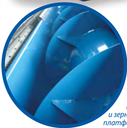
Шнек и зерновая платформа